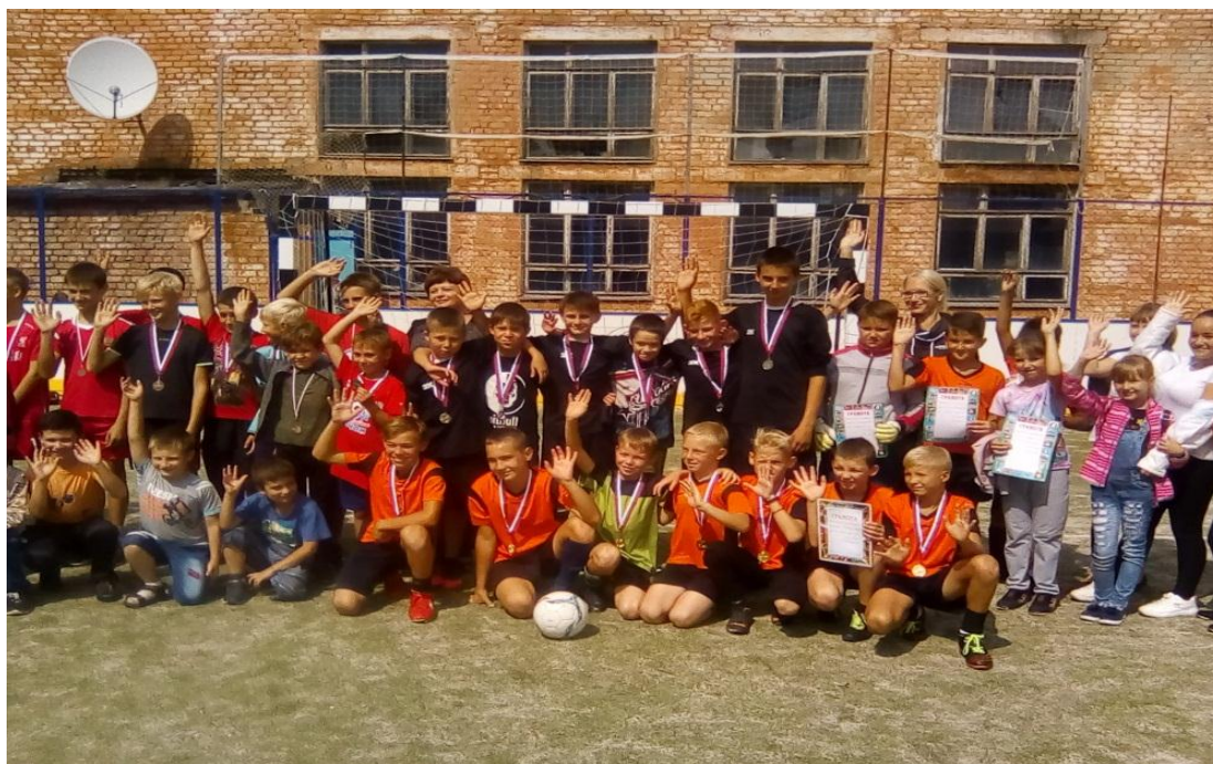
Рисунок 2 Урок физкультуры «План режима дня;