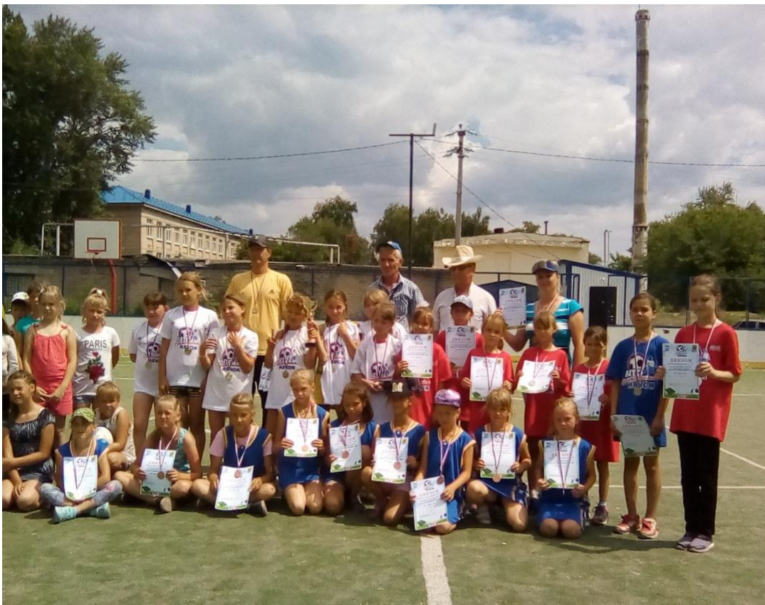
Рисунок 4 Лето с футбольным мячом.