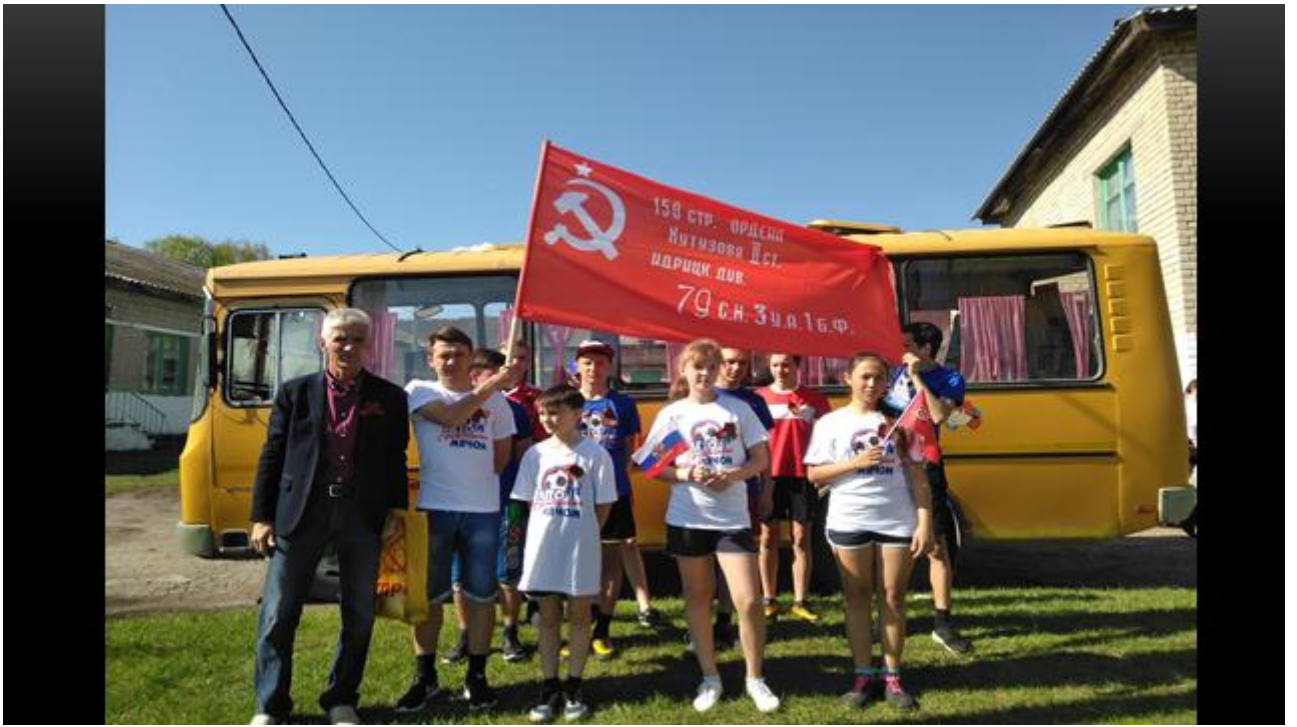
Рисунок 7 Пробег «Победа»