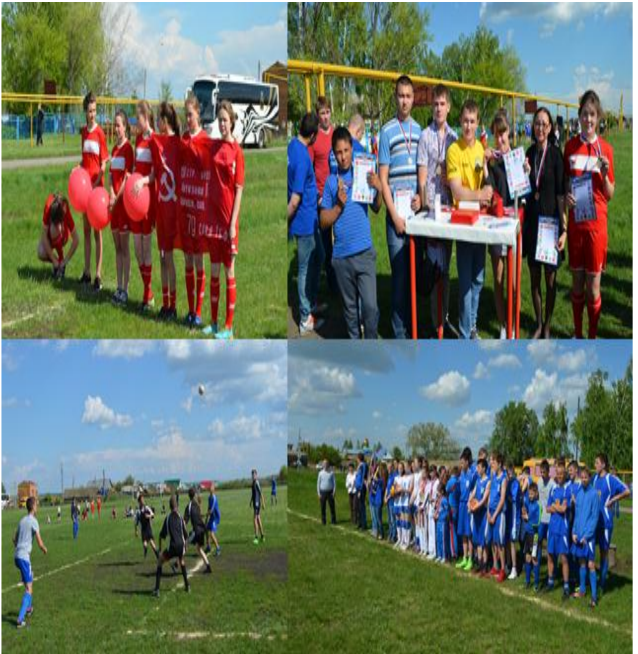
Рисунок 8 Спортивный праздник «Школа территория здоровья»