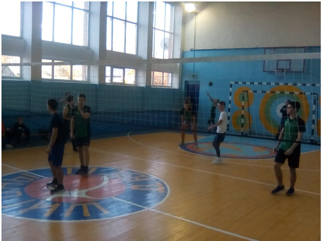
Рисунок 6 Волейбол соревнования среди школ