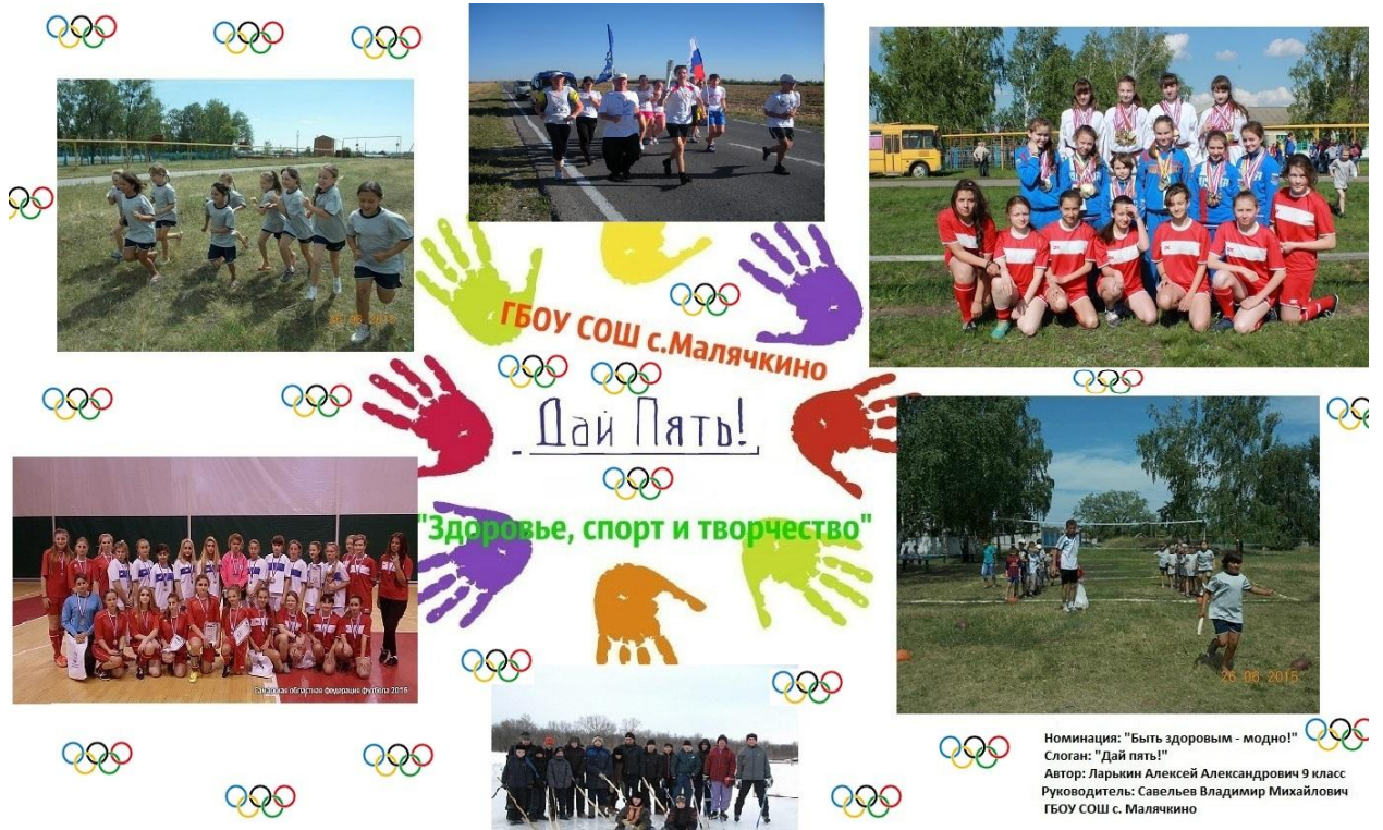
Рисунок 5 «Быть здоровым – модно!»