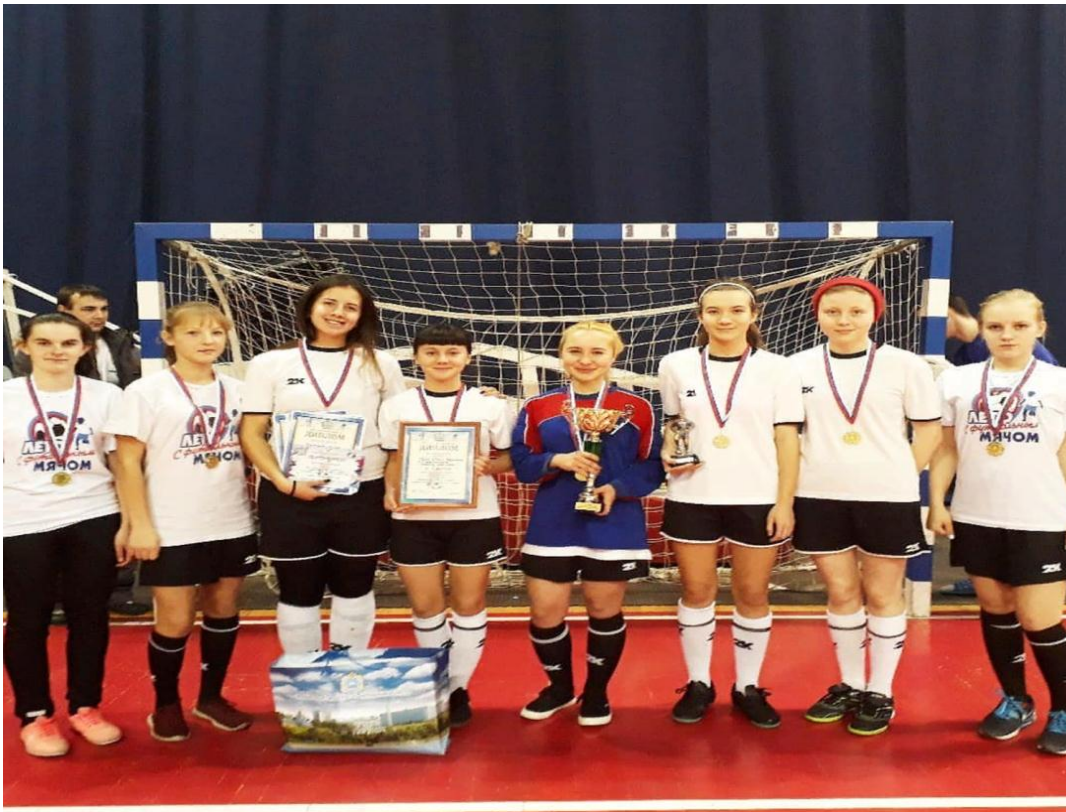
Рисунок 3 «Мини- футбол в школу» - мы чемпионы области.