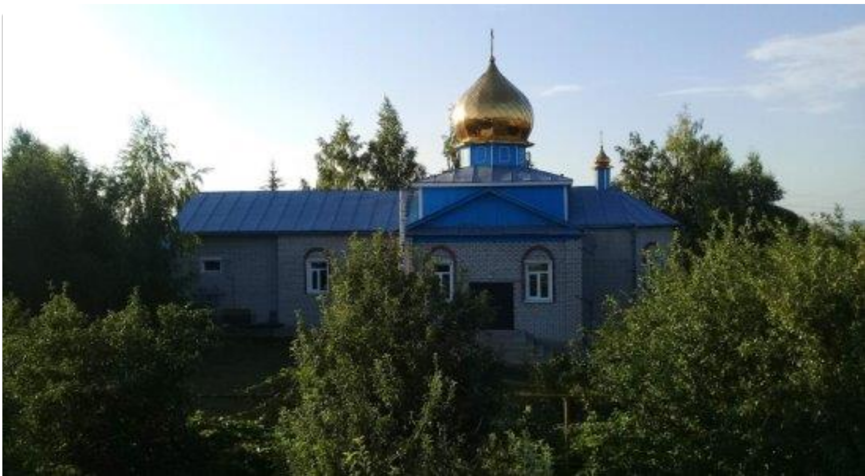
Храм Казанской иконы Божией Матери