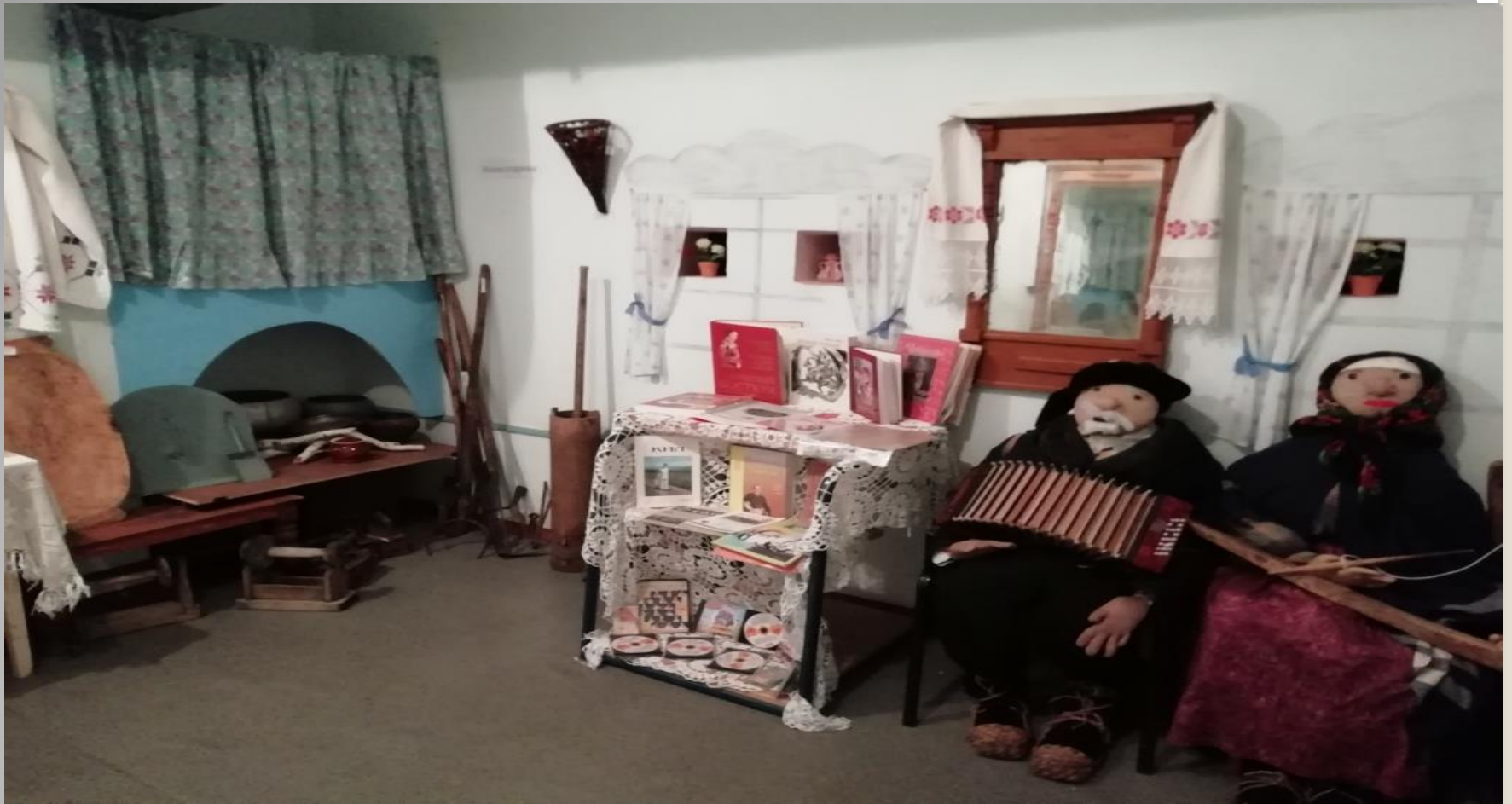
Печка - камака