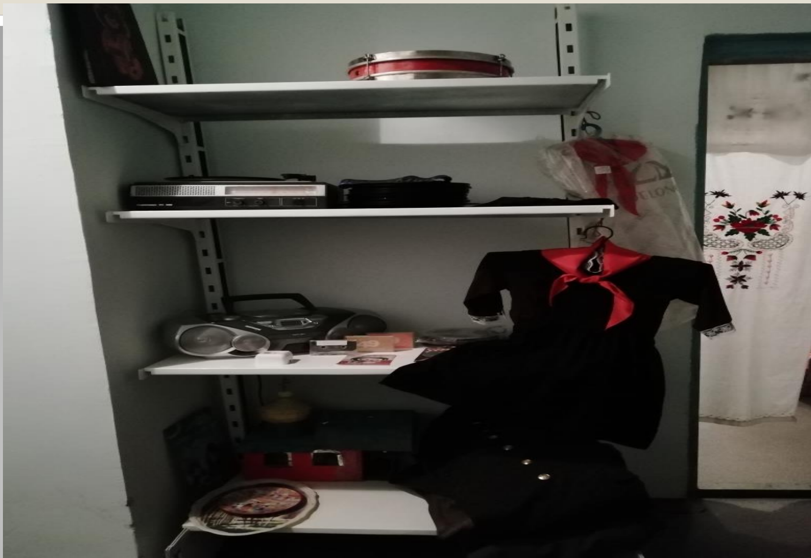
Уголок «Советского Союза»