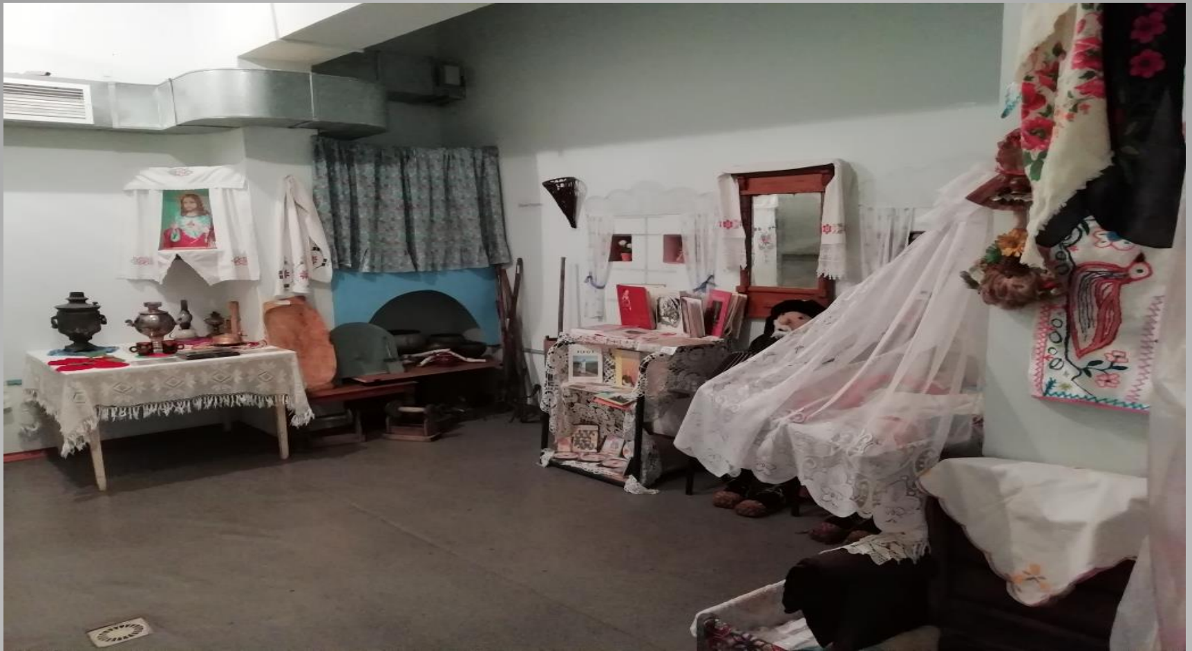
Музей «Культура и быт чувашской старины»