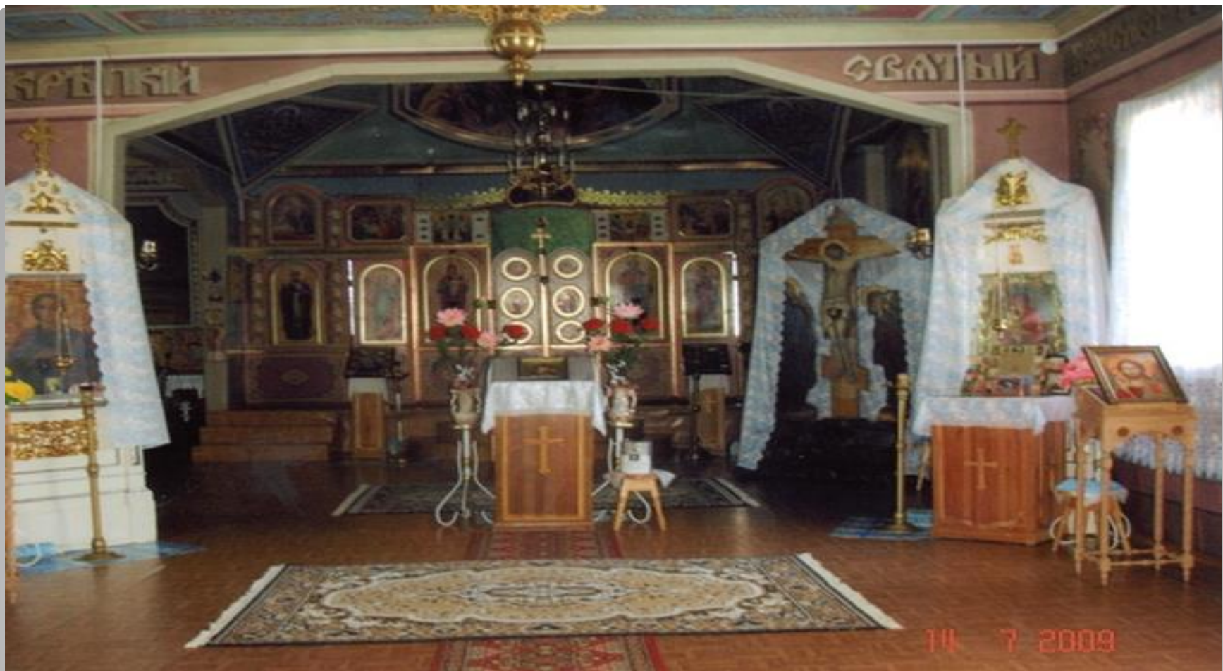
Внутреннее убранство храма